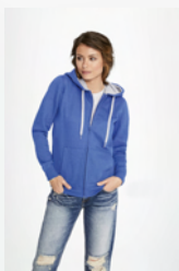
SOUL WOMEN 47100