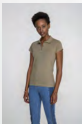
PRESCOTT WOMEN 11376