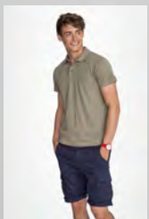
PRESCOTT MEN 11377