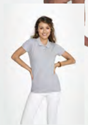
PERFECT WOMEN 11347