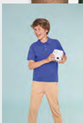
SUMMER II KIDS 11344