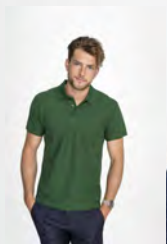
SUMMER II 11342