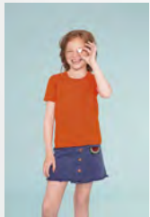
MILO KIDS 02078