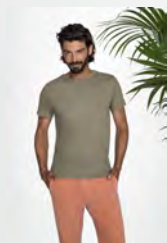
MILO MEN 02076