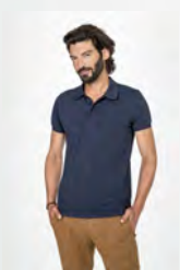
PHOENIX MEN 01708