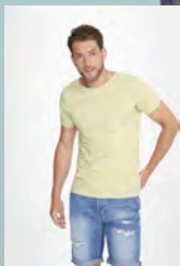
MILES MEN 01398