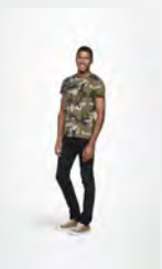
CAMO MEN 01188