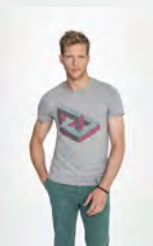
MIXED MEN 01182