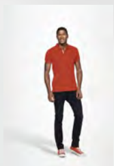
PORTLAND MEN 00574