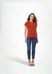
PORTLAND WOMEN 00575