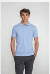
PRIME MEN 00571